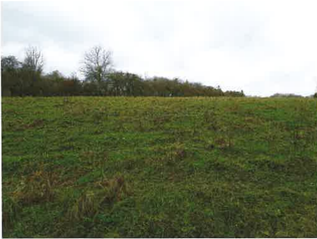
Carte n°1 : Plan de situation